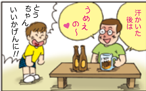
5月から住民健診が始まりました!!