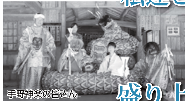
手野神楽の皆さん