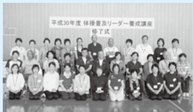
平成30年度前期養成講座受講者の皆さん