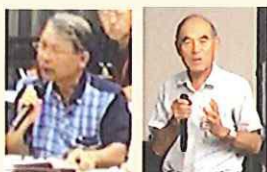
第1回寄ろう会から視えてきたもの