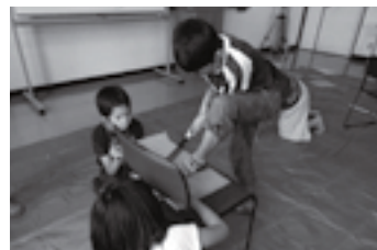
発明展出品作品の製作