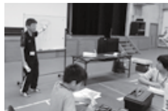
ミニチュアロケット作り