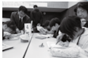
ジャイロごま作り

子どもの頃の体験は、少なからず大人になってからの社会生活に影響を及ぼします。子ども達へ積極的な参加を勧めてください。