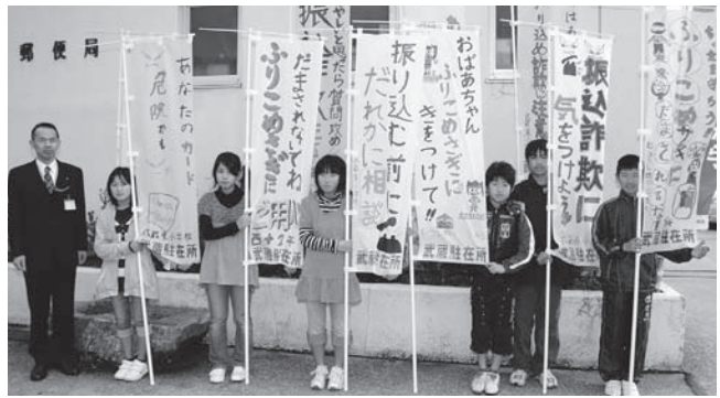
▲武蔵郵便局で行われた贈呈式に出席した武蔵東小学校の6年生

この後、のぼり旗は、大分空港に1週間掲示された後、管内の金融機関に贈られました。