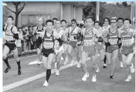
▲富来小学校の再スタート