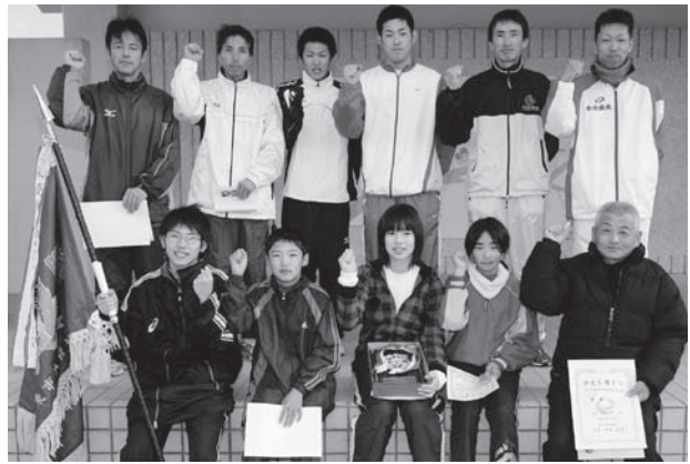
▲優勝した「安岐中央A」の皆さん