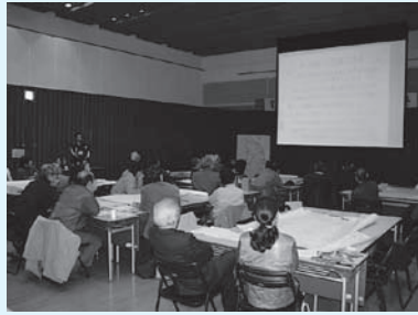
モデルコースの発表の様子