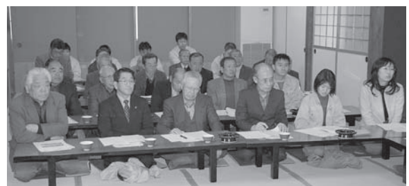
▲集落営農法人の代表者や、県、市の関係者約30人が出席