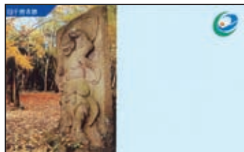
▲横タイプ(旧千燈寺跡)