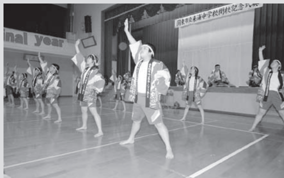
▲来浦中ソーランを元気に披露しました(来浦中学校・2月15日(日))