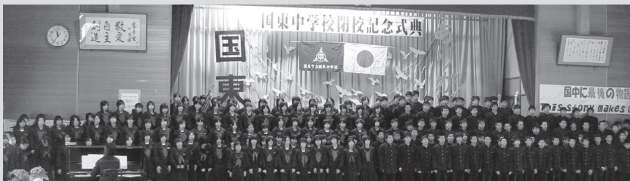
▲全校生徒で合唱しました(国東中学校・2月22日(日))