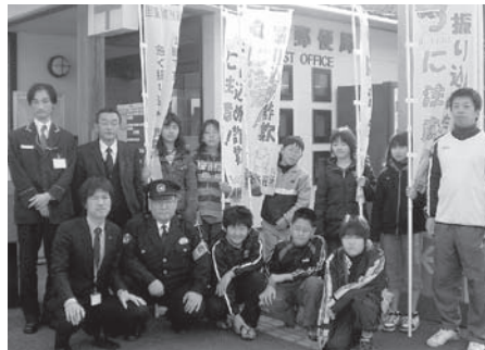
◀2月12日(木)、熊毛小学校6年生8人が熊毛郵便局にのぼり旗を贈りました