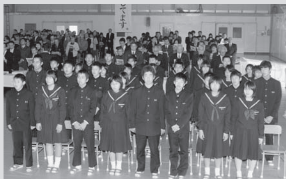
▲参加者全員で校歌を斉唱しました(富来中学校・2月8日(日))

生徒や保護者、来賓をはじめ地域の皆さんや卒業生、歴任教職員が出席して各校で行われた式典では、学校の歴史を振り返るスライド上映や、記念碑の除幕式などの記念行事も行われ、思い出がいっぱい詰まった学び舎との別れを惜しみました。