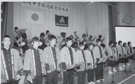
▲横手地区に伝わる「さくなが音頭」を太鼓、三味線の演奏にあわせて歌いました(城崎中学校・2月15日(日))