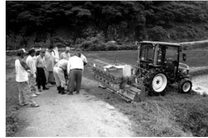
▲飼料米ショットガン播種作業風景