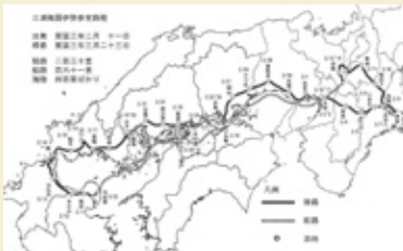
三浦梅園 伊勢参宮 旅程

豊後高田、中津、小倉、下関、そして「山陽道」の宿場宿場を経て、大阪、奈良をめぐり、伊勢神宮へ。帰りは伊勢から琵琶湖、京都をめぐり大阪に出ています。大阪からは船旅で、途中四国の金比羅宮に詣り、国東に帰っています。