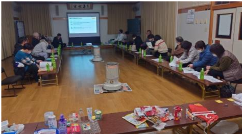
家庭ごみを持ち寄り確認