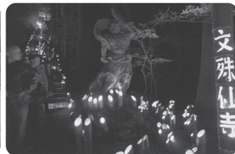
点火した竹ぼんぼり