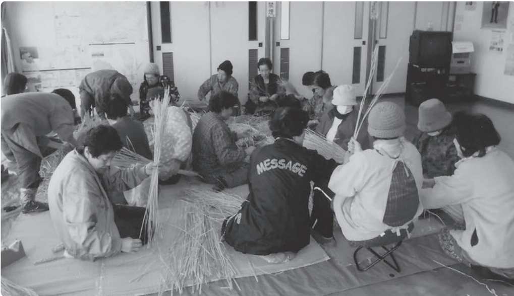
安国寺老人クラブ寿会健康づくり教室でのしめ縄作り

国東市では、高齢者の方ができるだけ介護が必要な状態にならずに自立した生活ができて、日ごろから地域で健康づくりに取り組むグループに活動助成を行っています。