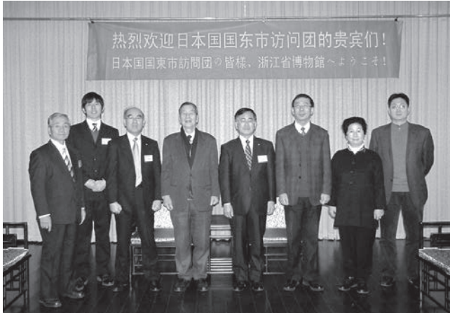
今回の訪中の様子

国東市は、平成8年度から平成12年度の5カ年で国史跡安国寺集落遺跡保存整備事業を実施しました。その際、高床建物を復元整備している中国浙江省の河姆渡遺跡を参考とするために中国浙江省を視察し、平成13年に弥生のムラ国東市歴史体験学習館と国史跡安国寺集落遺跡公園をオープンしました。オープンの際には、中国浙江省博物館から出土品を借用して、開館記念特別展を開催するなど、その後も姉妹館として企画展やシンポジウム、講演会などの交流が続いています。