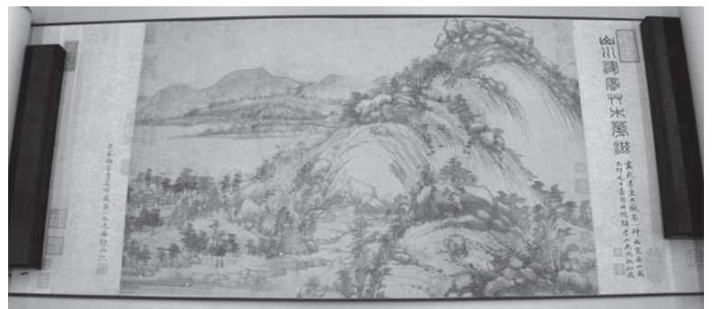
富春山居図巻剩山図 縦31.7cm、横51.2cmの水墨画 (全体では長さ9.39mの巻物)

今回寄贈された第2品目は、元時代末の黄公望作の水墨画「富春山居図巻一剩山図」です。これは「剩山図」です。これらはいずれも浙江省博物館所蔵の10大館宝の複製品です。なお、今回寄贈された「富春山居図巻」は4月中旬から一般公開する予定です。