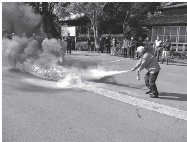
△消火器を使った初期消火訓練の様子

1月29日(日)、市指定文化財の「神門」と「大楠木」がある武蔵町三井寺の椿八幡社で「文化財防火デー(1月26日)」にちなんだ文化財防火訓練が行われました。地区の皆さんをはじめ、市消防本部や地元の消防団、神社の関係者など約60人が参加して放水訓練や消火器を使った初期消火訓練を行いました。 訓練では、地元の皆さんが文化財に見立てたダンボール箱を運び出すと、消防署員や消防団員が機敏な動きでホースをつなぎ、放水を行いました。