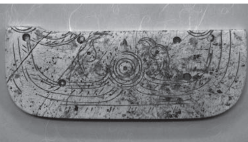
双鳥朝日象牙雕刻件 縦6.5cm、横16.5cm

これまでの17回にわたる文化交流で、国東市は浙江省博物館から2品目の寄贈を受けました。第1品目は、河姆渡遺跡出土品「双鳥朝日象牙雕刻件」です。