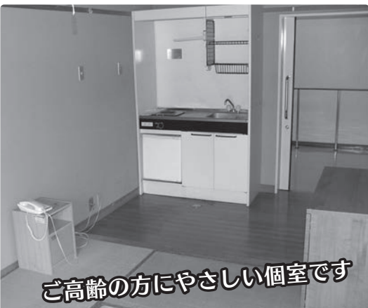
ご高齢の方にやさしい個室です