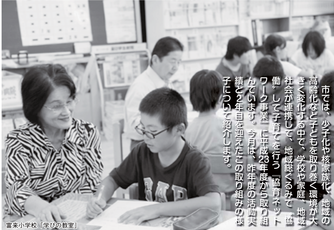
富来小学校「学びの教室」

市では、少子化や核家族化、地域の高齢化など子どもを取り巻く環境が大きく変化する中で、学校や家庭、地域社会が連携して、地域総ぐるみで「協働」して子育てを行う「協育ネットワーク事業」に平成23年度から取り組んでいます。今月は、昨年度の活動実績と2年目を迎えたこの取り組みの様子について紹介します。