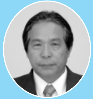
綾部 敦 議員