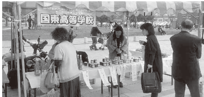
▲門司港レトロ物産展でジャムやジュースを販売する国東高校生