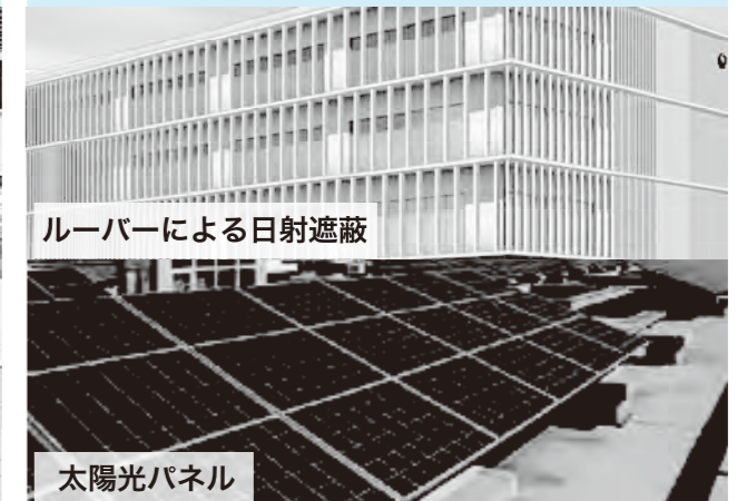
ルーバーによる日射遮蔽