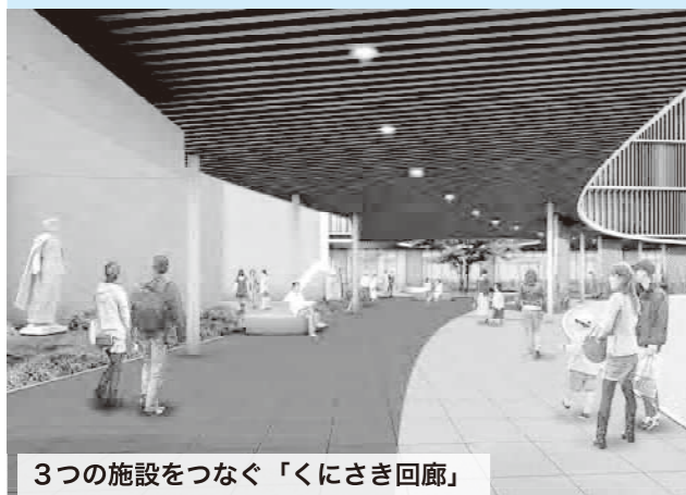
3つの施設をつなぐ「くにさき回廊」

大きな屋根がつながる「くにさき回廊」は、安全な歩行通路、車寄せのほか、さまざまなイベント会場としても利用できます。