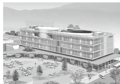
▲市役所本庁舎完成イメージ