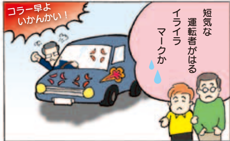
春の交通安全運動 4月6日(日)~4月15日(火) イライラ運転に注意してネ!