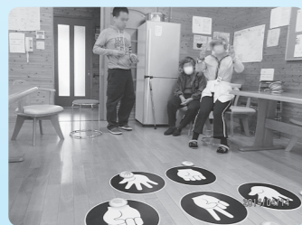
「じゃけんベタンコ」投げて、勝負！さあ、何点とれたかな～