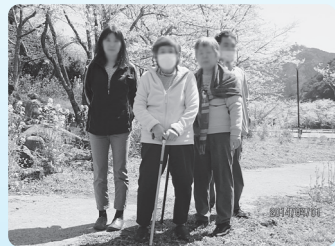
安岐ダムで満開の桜の中を散策、とても綺麗でした

「生活介護」は、主に常時介護を必要とする方（病院を退院したばかりの方や、お仕事が難しい方など）を対象に、日常生活上の支援や、創作的活動、生産活動の機会の提供などを行い、生活能力の向上を図っています。また、散歩や、軽スポーツなどで、身体機能の向上も図っています。ゆっくりと一人ひとりのペースに合わせ、独自のプログラムを進め、楽しみながらQOL（生活の質）を高めていきます。