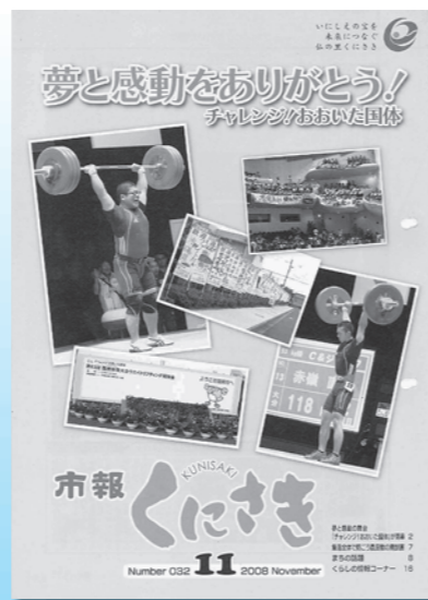
平成20年 11月号 (第32号)

10月チャレンジおおいの国体開催。国東市はウェイトリフティング会場で沸いた。新しく国東高校、安岐中央小学校が開校。