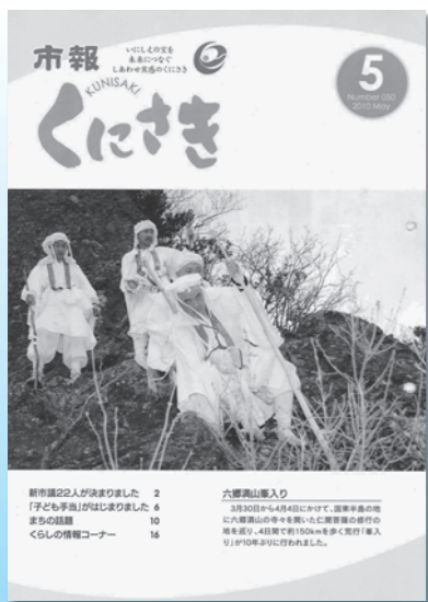
平成22年 5月号 (第50号)

六郷満山峯入りが10年ぶりに行われ、お接待で行者をもてなす。ケーブルテレビ市内全域開通。大分空港道路無料化。