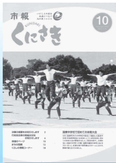
平成21年 10月号 (第43号)

国東町内の4校が統合した新しい国東中学校で初の体育大会。黒津崎海岸でウミガメの産卵を発見。とみくじマラソンが20周年。