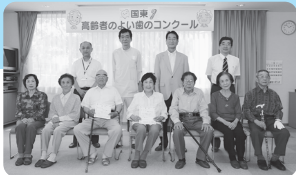
▲優良賞以上のみなさん（前列）