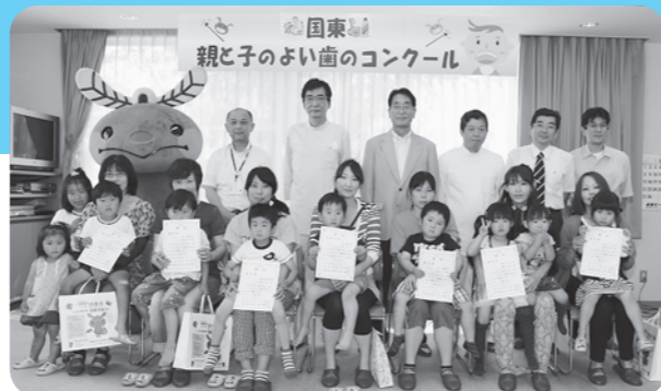
▲優秀賞以上のみなさん（前列）