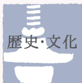
History & Culture