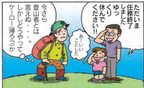
〈15日はケーローの日です〉 (敬老)