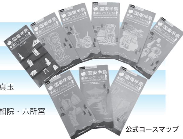
公式コースマップ