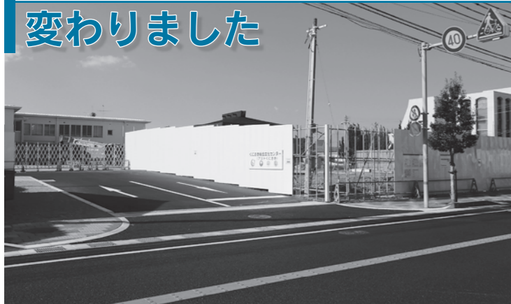
▲国道側入口（11月20日撮影）

アストくにさきの国道側入口変更と、南側道路の新設及び南側駐車場整備を含めた外構工事(第1期)が完了しました。