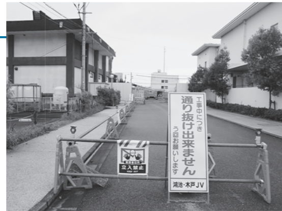
▲ケーブルテレビセンター裏側（11月25日撮影）

なお、アストくにさき西(裏)側の国東小プール前から、新設した南側道路への進入もできます。