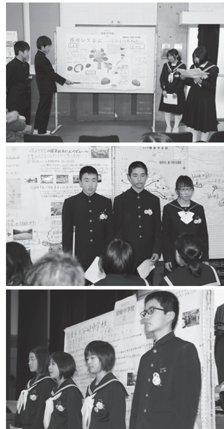
▲ポスターセッションで発表する(上から)国見中、国東中、安岐中の生徒