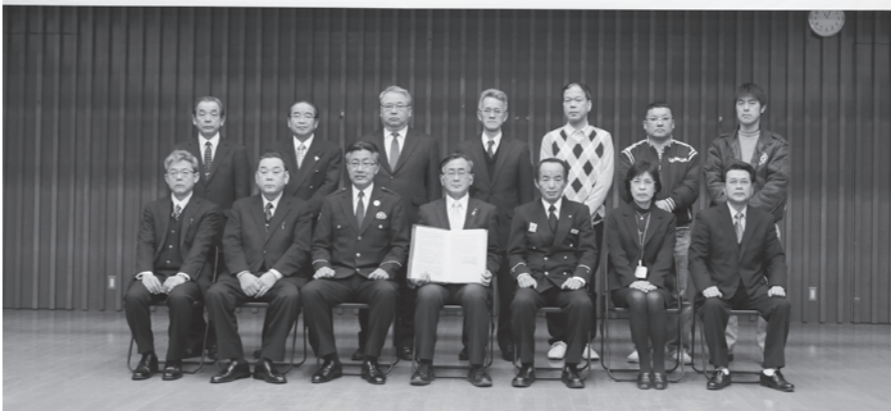
▲協力機関の代表者が出席して行われた発足式