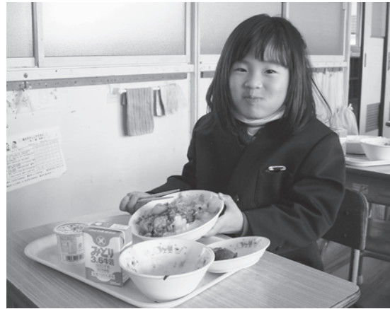
▲「マーボ里芋がおいしかったよ」(国東小学校)

また、1月24日～30日の「全国学校給食週間」に合わせ、地元食材を使った献立を提供しました。国見調理場は郷土料理「たこめし・石垣もち」、国東学校給食センターは、安永醸造の塩麹を使った「県産さばカレー塩麹焼き」、安岐調理場は「タコの唐揚げ・団子汁」を調理しました。