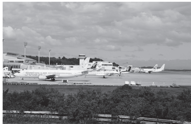
▲利用客の増加が期待される大分空港

現行 午前7時30分 午後9時30分(14時間) 変更後 午前7時30分 午後10時30分(15時間) 実施は3月29日(日)からです。みなさまのご理解をお願いします。