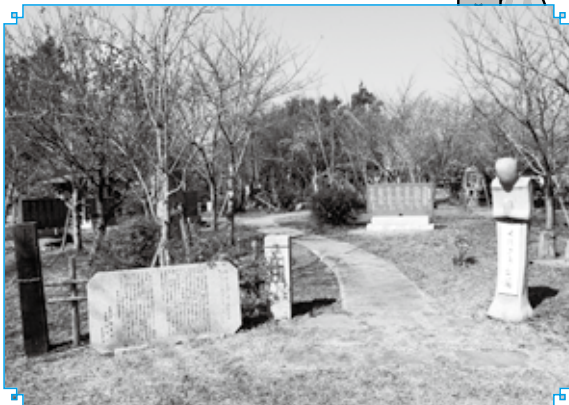
▲くにさき公園入口