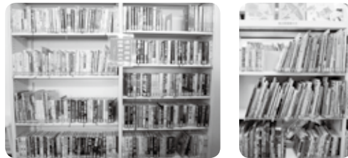
▲県立図書館団体貸出文庫 一般書(左) 児童書(右) (安岐図書館)

さて、今月はシステムの更新に伴い国東市の図書館は全館休館します。期間は11月21日から30日までです。図書館を利用される皆さまにはご迷惑をおかけします。なお休館中の本の返却は返却ポストをご利用ください。