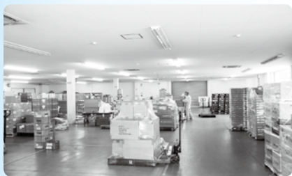
▲小城物流センターの出荷作業場