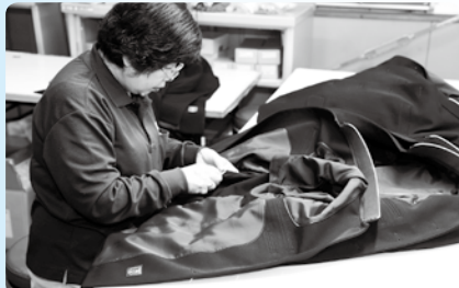
▲完成品の最終チェック

センターを県内に4箇所、県外に1箇所新設しました。また、部品保管のために、空港や港、工場まで部品を取りに行く運送業を行うようになり、トラック40台を所有しました。こうして、物流業と運送業の両輪で事業を拡大してきました。しかし、平成20年頃からは物流と運送の仕事が減少していき、社員の雇用を守るためにも新規事業がないかと探していたところ、国東町田深に縫製工場の跡地があり、縫製設備もそのまま使え、その工場で働いていた職員を確保したこともあり、縫製業に進出することにしました。しかし、社員の技術力不足等で、なかなか軌道に乗りませんでした。そこで、打開策として製造する製品を大手学生服メーカーの上着に絞ることにしました。ベトナムからの研修生を受け入れ、年間3万着の学生服の上着を製造するようになり、今では縫製業はテクノを支える主要な事業に成長しました。 今後は、運送業者としてこれだけの物流倉庫を所有する会社は数少ないので、その特性を活かした物流・運送の形態を生みだしていきたい。そして、縫製業において、地元の人たちの雇用を拡大していきたいそうです。