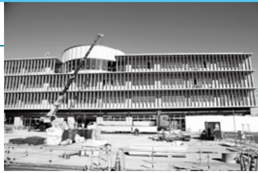
◀新庁舎正面・アストくにさき 駐車場から撮影

また、10月末に国道側から受電していた新庁舎の仮設電源を本設に切り替えて工事を進めています。これから内装仕上げがメインとなり、冷暖房設備の繋ぎ込み、照明器具の設置をしていき、出来上がったところから試験運転を進めていきます。