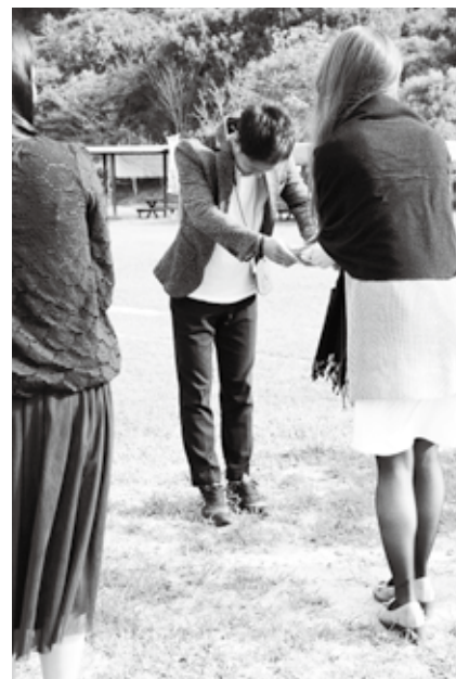
▲イベント終盤の男性告白タイム

(女性)、「国東市の男性との婚活に積極的な女性と接する事ができ、勇気を出して参加して良かった。(男性)」など、事前のプロフィール公開に前向きな意見が多く、有意義で充実した2日間となりました。