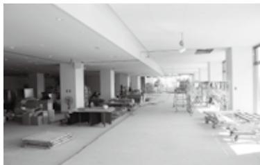
▲1階フロア・西側から国道側に向けて撮影