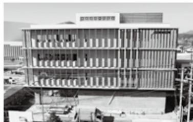
▲新庁舎東側・国東警察署屋上から撮影

今後、くにさき回廊の基礎掘削工事を開始し、重機による作業を再開します。車両の出入りが多くなりますので、誘導員を配置して場内徐行運転と一旦停止場所の厳守及び歩行者優先など安全第一で工事を進めていきます。ご協力よろしくお願いいたします。