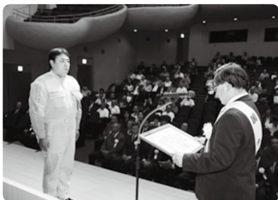
▲国東市長から表彰を受けるトヨタカローラ大分株式会社 国東店