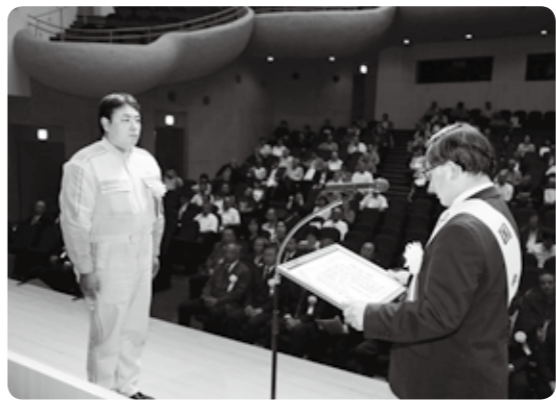
▲国東市長から表彰を受けるトヨタカローラ大分株式会社 国東店

10月2日(金)、アストくにさきで、国東市、姫島村の関係者約260人が出席して平成27年度国東地区交通安全大会が開催されました。交通事故犠牲者への黙とうが捧げられた後、交通安全に貢献された団体・個人に対して各種表彰と表彰状の伝達が行われました。続けて行われたアトラクションでは、女性ドライバー協議会の皆さんが南京玉すだれと「飲んだらのれん」の踊りで、飲酒運転の根絶を呼びかけました。また、六郷鬼龍太鼓の皆さんが太鼓パフォーマンスで会場を沸かせました。 なお、表彰された方々は、次のとおりです。 〔国東市関係分・敬称略・( )内は分会名〕