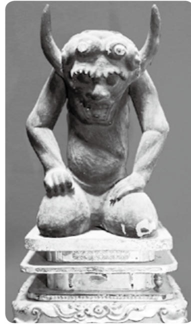
木造角大使坐像(文殊仙寺所蔵)

この企画展が実現できたのは、六郷満山文化の魅力を少しでも多くの方に知ってもらいたい。そして、3年後に行われる六郷満山開創1300年祭への気運を高めていきたいと各寺院が連携し、協力していただいたおかげです。これだけの寺宝が一箇所に集まることは、今までになかったことです。また、今まで一般未公開の秘仏も展示されています。