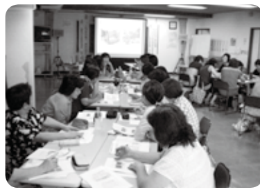
調理従事者研究会

給食センター(国見・国東・安岐)では、おいしい給食であることとはもちろんのこと、安心して食べられる安全な給食を目指しています。そのため毎年、主に夏季休業中に、調理従事者を中心に合同で研修会を行っています。