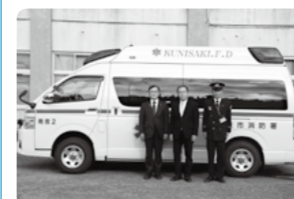
▲左から三河市長、南 所長、岡田消防長

一般財団法人空港環境整備協会の助成を受け、12月10日(休)、国東市消防署南分署に、新しく最新鋭の高規格救急自動車が配備されました。