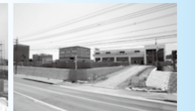
▲平成27年3月26日 新庁舎建設工事の様子