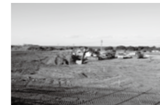
▲平成26年3月10日 用地造成工事の様子

平成27年1月…無線デジタル化事業着手(機器) 5月29日…新庁舎完成 6月…無線の庁舎内工事着工 7月…新通信指令装置への情報入力 9月末…デジタル無線整備工事完了 新通信指令装置への情報入力完了 10月…備品関係整備、指令装置と無線の試験運用 11月15日…旧消防本部・署閉鎖 11月16日…新消防本部・署業務運用開始 12月1日…落成式