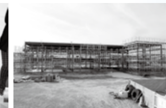
▲平成27年1月5日 新庁舎建設工事の様子