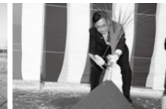
▲平成26年10月14日 新庁舎建設工事起工式の様子