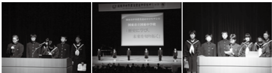
▲ステージ発表する(左から)国見中、国東中、安岐中の生徒