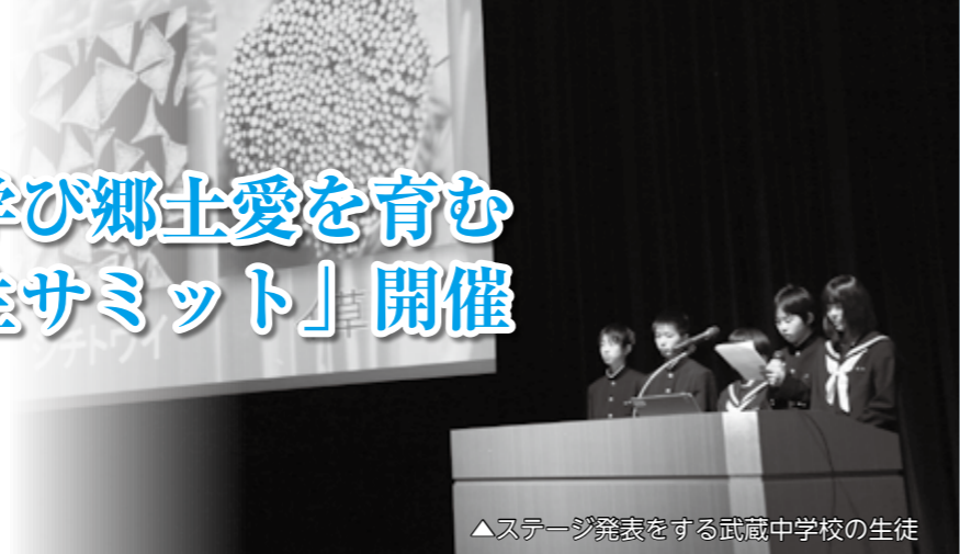
▲ステージ発表をする武蔵中学校の生徒

学習発表では、国見中学校は「ふるさと国見を世界に発信しよう!!」、国東中学校は「歴史に学び、未来を切り拓く」、武蔵中学校は「国東半島の今と昔」、安岐中学校は「地域に誇れる『七島イ』と『乾しシイタケ』」と題して、自分達が調べた内容を発表しました。後半のシンポジウムでは、各校の代表2名ずつが「循環型農林水産業や伝統文化のすばらしさ」「世界農業遺産で学んだこと、これからの人生に活かしていきたいこと」の2つのテーマについて意見交換をしました。最後に「故郷から学び、故郷を守り、故郷を育てていく」とサミット宣言をしました。