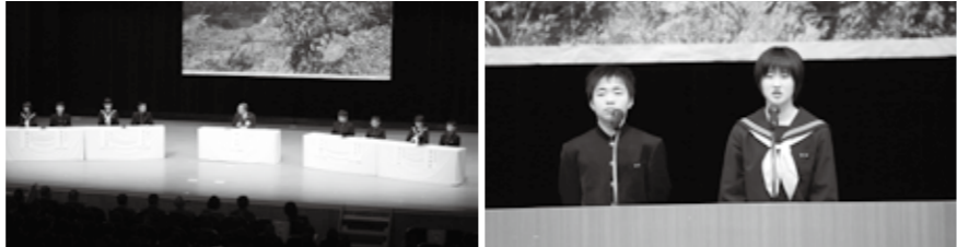
▲シンポジウムの様子