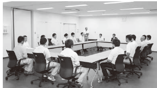
※災害時急性期に活動できる機能性を持つようにトレーニングを受けた医療チーム

国東市では、今回出された意見などを基に、現在立てている防災・避難対策の見直しを行っていきます。