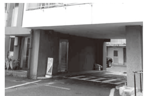
▲旧庁舎内の通り抜け箇所