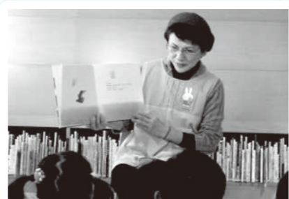
▲くにさき図書館 おはなし会の様子