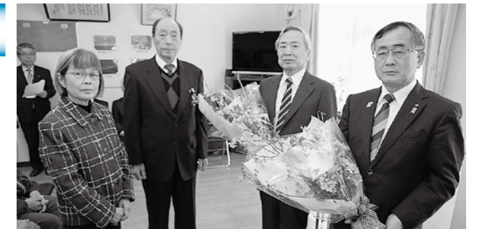
▲姫見苑で入所者の家族代表から三河市長と堀田理事長に花束が贈られました