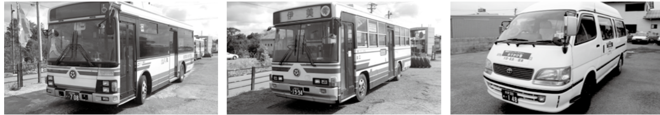
▲大分交通 ▲国東観光バス ▲コミュニティタクシー