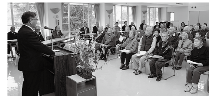
▲くにみ苑の運営移譲式であいさつする三河市長