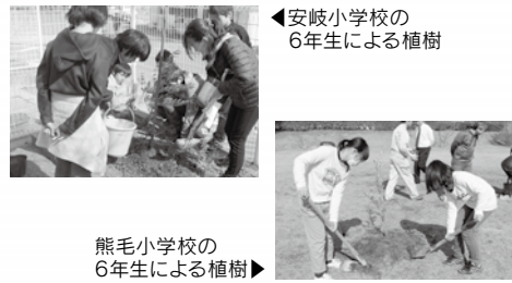
熊毛小学校の6年生による植樹

NPO法人瀬戸内オリーブ基金から寄付を受けて、2月20日から3月6日までの15日間で市内10の小中学校にオリーブを31本植樹しました。卒業記念樹として子どもたちと植えた学校や、先生と植えた学校もありました。将来実がなり、学校で活用出来る日が来ることを願い真心をこめて植えました。