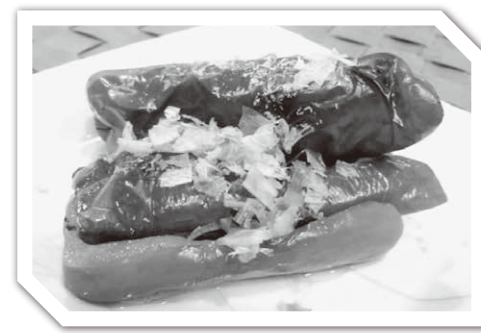
じっくり焼いたピーマンの甘みが美味しい! ピーマンの焼き浸し