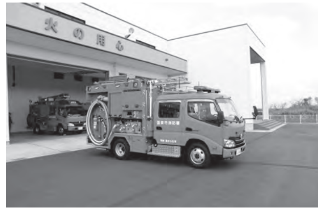
購入した消防ポンプ車