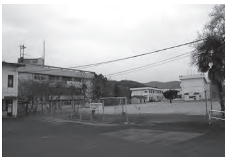
武蔵総合支所と武蔵東小学校

台風等により倒木が車道を塞いで人や車の通行に危険である等の緊急性を考え処理しておりますが、基本的には土地所有者及び関係者に立木処理をお願いしております。