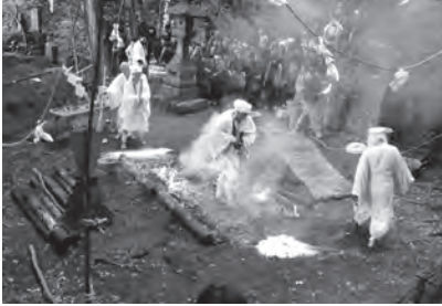
厄除け火渡りの様子

A 事業計画後、国の地方創生事業加速化交付金の事業採択を受けたことで、全て国費で対応できました。