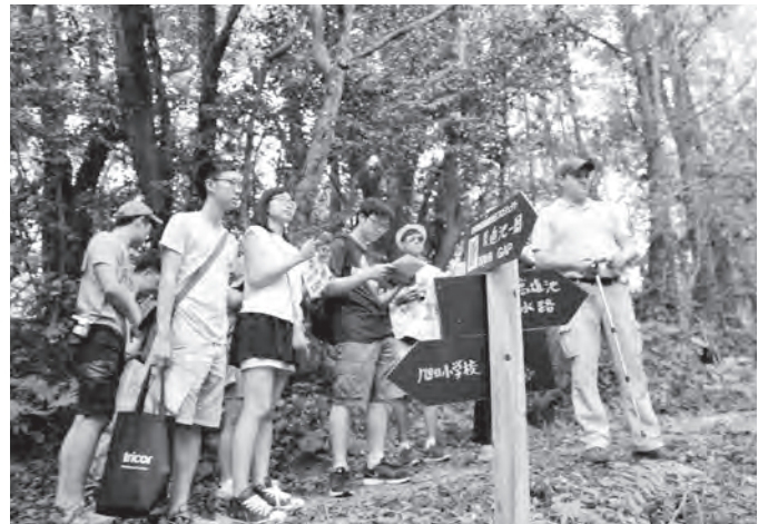
世界農業遺産を体験する香港からの大学生

これまで、県内、国内、外国での商談会に参加して、営業を行ってきました。新たに台湾・香港の文字対応のお客様パンフレットの作成やSNS用の動画も英語・中国語版等を作成し、ユーチューブへ配信も行っています。また、アメリカの大学生グループなどの招聘事業も実施し、観光協会のスタッフにアメリカ人の職員も既に雇用し、受入体制整備は観光トイレの洋式化、多言語ガイドフォンも一部で使用可能になりました。