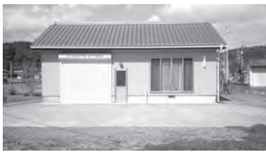
消防団詰所・機庫