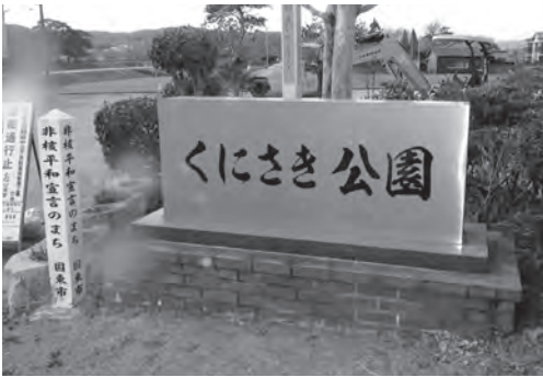
整備されたくにさき公園

3月末の完成に向けて駐車場整備を実施しています。職員駐車場及びアストのイベント時の臨時駐車場として利用を計画しています。くにさき公園は現状のまま利用していただくことで理解いただきたいと思います。