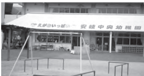
第2子から無料となる市立幼稚園

子育て支援対策として、子育て世帯を経済的に支援するために、現在、階層によっては第2子から使用料が無料であったものを、階層に関係なく第2子から無料とする