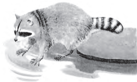
市内で生息が確認されているアライグマ