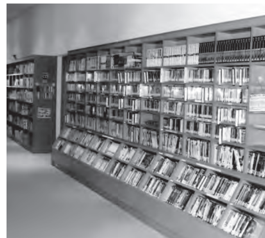
司書により整備された図書館