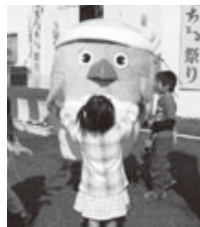
▲くにみちよるちよる祭りで(11/12)

●チャレンジ! おおいた国体についての問い合わせは 「チャレンジ! おおいた国体」国東市実行委員会 国東市 国体推進室内