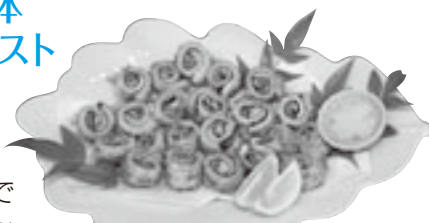
▲最優秀賞に選ばれたしいたけと太刀魚のロールフライ

なお、最優秀賞及び優秀賞の作品は国東市の地域アイデア料理として大分県実行委員会に推薦され、おおいた国体標準レシピ集に掲載される予定になっています。