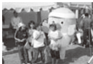
▲夢さきくにさきふるさとまつりで(10/29)

各会場ではめじろんグッズの抽選会や写真撮影会などの楽しい催しがあり、子どもたちに大人気となりました。