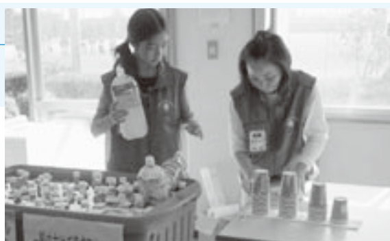
▲平成18年度開催の第61回国民体育大会(のじぎく国体・兵庫県)で活動する、大会ボランティアのようす