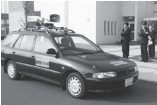
▲青色回転灯と「国東市防犯パトロール車」のステッカーをつけた パトロール車でパトロールに出発

市の公用車に青色回転灯をつけて防犯パトロールする「国東市防犯パトロール車」の出発式が2月5日(月)、アストくにさきで行われました。