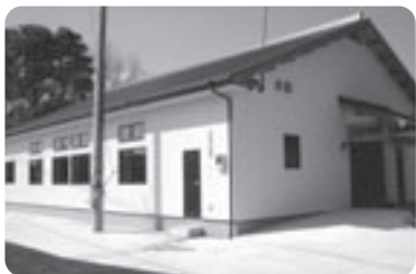
▲南糸原区 コミュニティセンター

南糸原区コミュニティセンター、下原西区コミュニティセンターは、木造瓦葺平屋建てで、それぞれ多目的ホール、小会議室や談話室、調理実習室等が整っており、今後、コミュニティ活動の拠点として地域活動に活用される予定です。