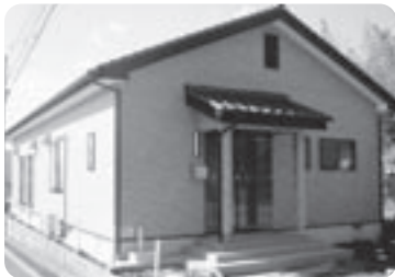
▼下原西区 コミュニティセンター

また、財団法人地域活性化センターの平成18年度活力ある地域づくり支援事業助成金を受けて、商工観光課が国東市観光パンフレット、ポスター及びホームページを作成しました。