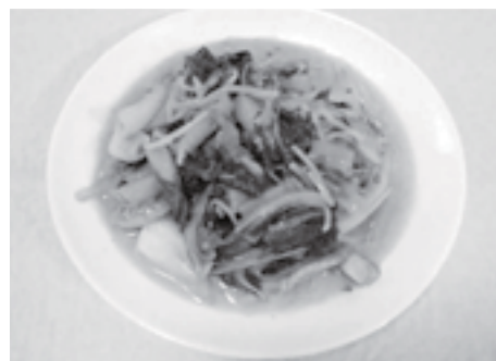
梅とマヨネーズの相性抜群