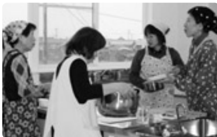
▲調理実習のようす