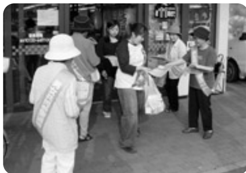
▲マルシヨク国東店でのキャンペーンの様子