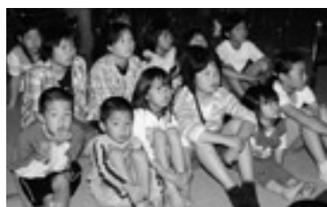
▲ビデオ鑑賞をする子どもたち