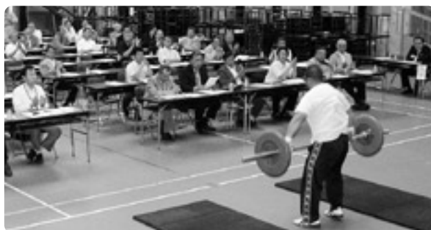
▲模範演技のようす

を推進する大会」「心がふれあう大会」を目指すことなどを柱とする開催基本計画を全会一致で承認したあと、本年度の基本計画や収支予算案の提案があり、本年11月に迫ったリハーサル大会に向けた諸準備に全力を挙げて取り組むことを確認しました。