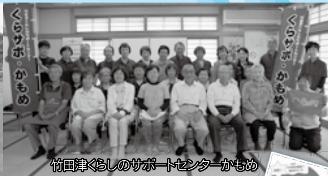
竹田津くらしのサポートセンターかもめ