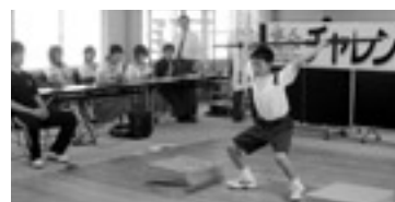
▲中学生による練習会のようす