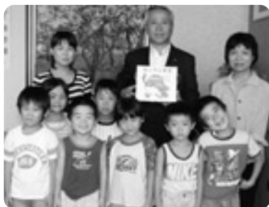
▲武溪保育所年長組の皆さん