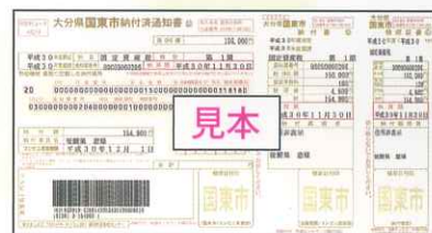
バーコード付納付書