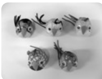
▲国東市婦人団体連絡協議会の皆さんに、一つひとつ愛情のこもった手づくりみやげを製作していただきました