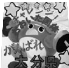
▲市内26の小中学校の児童生徒の皆さんが製作した応援看板が、出場する選手に勇気を与えることでしょう