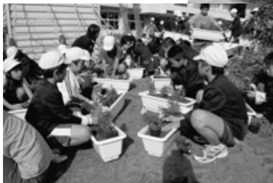
しんぐる 小原「幸来の会」の皆さん(写真左)と国東小学校の皆さん(写真右)に、会場に飾り付けられるパンジー・キンギョソウ・ナデシコなどのプランターの花の植え付け・管理を行っていただきました